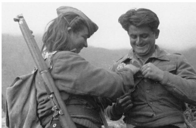
Γυναίκες και άντρες μαζί

«Σε μια στιγμή φτάνει ιδρωμένος ο επίτροπος του λόχου και μας λέει: “ποιος από σας ξέρει το μέρος να πάει στην πρώτη γραμμή. Είναι ανάγκη: σταμάτησε ο όλμος, γιατί έσπασε το κλισιοσκόπιο κι ένα άλλο μικρό, αλλά αναγκαίο εξάρτημα και πρέπει να πάμε”. Ούτε πρόλαβε να τελειώσει τη φράση του και πετάχτηκα: “Εγώ”, φώναξα δυνατά... Ταχτοποίησα λίγο το χιτώνιο, το δίκωχο στραβά, παίρνω το στάγιερ και τον αχώριστο “σύντροφό μου” τον τηλεβόα και προχωρώ προς τον επίτροπο. Σαν να ξαφνιαστήκε, θα περίμενε να πάει κανένα αγόρι... Τις σκέψεις του αυτές τις διέκοψα εγώ, λέγοντας “όχι και... υποτίμηση συναγωνιστή... ισότητα στην πράξη... [...]» 57 .