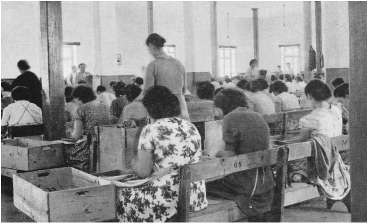
Καπνεργάτριες στο Μεσοπόλεμο

τιμάται για πρώτη φορά από το ΚΚΕ η 8η Μάρτη ως ημέρα μνήμης και αγώνα για την κοινωνική και ταξική χειραφέτηση της γυναίκας. Την ίδια περίοδο, θα αρχίσει και η συμμετοχή των πρώτων γυναικών στους εργατικούς αγώνες. Από τα μέσα της δεκαετίας του 1920, εργάτριες συμμετείχαν στις απεργίες που ξεσπούσαν σε τομείς που απασχολούσαν μεγάλο αριθμό γυναικών, όπως τα υφαντουργεία, τα ταπητουργεία και η καπνοβιομηχανία, ενώ την ίδια περίοδο οι γυναίκες αγρότισσες έδιναν το παρόν στις μεγάλες πορείες πείνας του αγροτικού κόσμου. Κάποιες από αυτές τις γυναίκες μάλιστα, έχασαν και τη ζωή τους στα οδοφράγματα και τις περιφρουρήσεις μαχητικών απεργιών, όπως η καπνεργάτρια της Καβάλας Μαρία Χουσιάδου, που δολοφονήθηκε σε οδόφραγμα το 1924 και η έγκυος και μητέρα δύο παιδιών Βασιλική Γεωργαντζέλη, η οποία δολοφονήθηκε ύστερα από την επίθεση της αστυνομίας στην απεργιακή διαδήλωση των εργατών του «Παπαστράτου» στο Αγρίνιο το 1926.