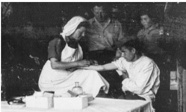
Νοσοκόμα του ΔΣΕ

Μεγάλο ποσοστό των γυναικών έγιναν, επίσης, τηλεφωνήτριες, έχοντας παρακολουθήσει τις σχολές ασυρματιστών, μηχανικών και τηλεφωνητών του ΔΣΕ. Στις σχολές συνδέσεων και διαβιβάσεων του ΔΣΕ το 50% ήταν γυναίκες 52 . Η πιο «γυναικεία» ωστόσο θέση, όπως παραδοσιακά συνέβαινε σε κάθε πόλεμο, ήταν αυτή της νοσοκόμας. Στις υγειονομικές υπηρεσίες του ΔΣΕ πάνω από το 80% του προσωπικού ήταν γυναίκες, που πρόσφεραν τις υπηρεσίες τους είτε ως γιατρίνες ή νοσοκόμες είτε στελεχώνοντας διοικητικές θέσεις. Παράλληλα, πολλές ήταν οι γυναίκες τραυματιοφορείς, που εκτελούσαν το εξαιρετικά δύσκολο και για τη σωματική τους διάπλαση έργο της μεταφοράς των τραυματιών.