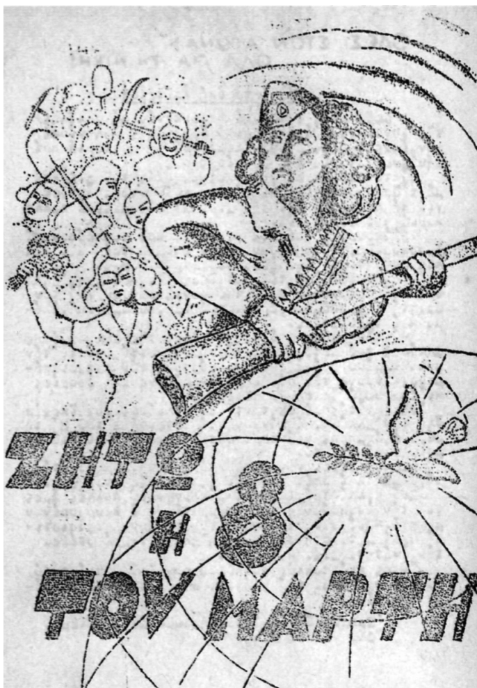
Αφίσα του ΔΣΕ για την 8η Μάρτη

δημοκρατικό κίνημα, ήταν κάθε φορά η γείωση του γυναικείου ζητήματος στις συγκεκριμένες συνθήκες της κοινωνικής, οικονομικής και πολιτικής πραγματικότητας της χώρας. Αυτό συνέβη στο Μεσοπόλεμο, αυτό συνέβη στην Κατοχή αυτό θα συμβεί και στον Εμφύλιο.