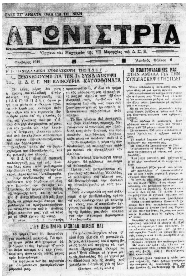
Εφημερίδα των γυναικών του ΔΣΕ

Επιπλέον, στην κατεύθυνση της διαφώτισης και της ξεχωριστής πολιτικής δουλειάς, από το 1948 είχαν αρχίσει να εκδίδονται εφημερίδες γυναικών. Το καλοκαίρι του 1948 εκδόθηκε το πρώτο φύλλο της Μαχητριάς ως κεντρικού οργάνου των μαχητριών του ΔΣΕ, που συνέχισε να εκδίδεται μέχρι το καλοκαίρι του 1949. Στην ύλη της περιλαμβάνονταν ανταποκρίσεις από τις μάχες, άρθρα και πολιτικοί σχολιασμοί. Άλλες εφημερίδες μαχητριών που εκδιδόνταν σε διάφορα μέρη στα οποία δρούσε ο ΔΣΕ ή σε μονάδες του ήταν οι παρακάτω: Αγωνίστρια, Ηλέκτρα, Θεσσαλιώτισσα, Παρτιζάνα, Παρτιζάνες του Βίτσι, Καθημερινά Νέα 68 .