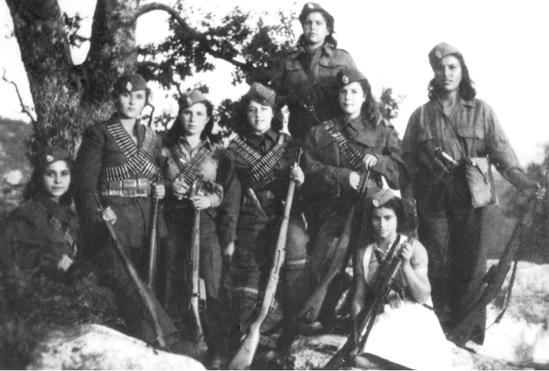
Μαχήτριες του ΔΣΕ

κορυφαίο παράδειγμα γυναικείου ηρωισμού και ως πρότυπο αντάρτισσας.