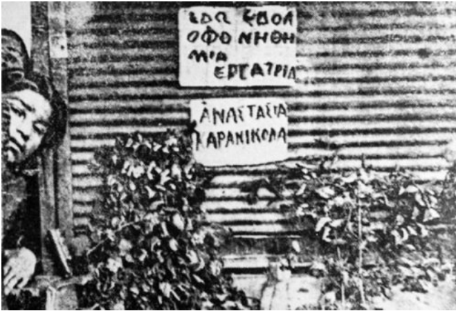
Εργάτρια στο σημείο δολοφονίας της Αναστασίας Καρανικόλα

ομηχανίας. Αποκορύφωμα της μαχητικής παρουσίας τους στις κινητοποιήσεις του κλάδου, υπήρξε η μαζική συμμετοχή των καπινεργατριών στη μεγάλη εργατική εξέγερση τον Μάιο του 1936 στη Θεσσαλονίκη, όπου βρέθηκαν στην πρώτη γραμμή των συγκρούσεων με τη χωροφυλακή και το στρατό. Μια από αυτές, μάλιστα, η κομμουνίστρια Αναστασία Καρανικόλα θα πέσει στις 9 Μαΐου νεκρή ύστερα από αλληπάλληλους πυροβολισμούς που δέχτηκε στο κεφάλι από μυστικούς αστυνομικούς.