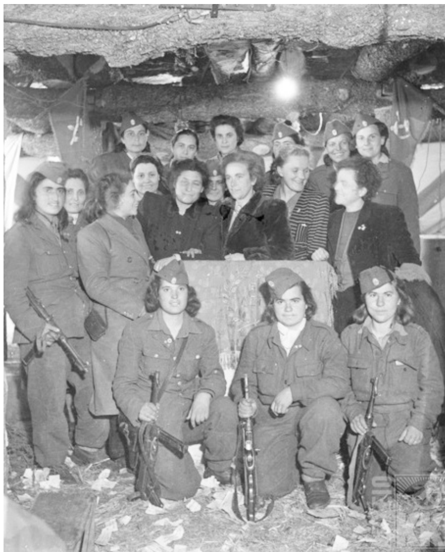
Στη Συνδιάσκεψη των γυναικών στο Βίτσι τον Μάρτιο του '49