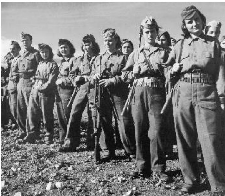
Αντάρτισσες του ΕΛΑΣ

Το καλοκαίρι του 1943, στο πλαίσιο της οργανωτικής αναβάθμισης του ΕΛΑΣ, συγκροτήθηκαν οι Υποδειγματικές Διμοιρίες Ανταρτισσών, στις οποίες εντάσσονταν, κατά βάση νέες κοπέλες, κυρίως επονοτίσσειες 17-23 ετών. Οι Διμοιρίες αυτές αποτελούνταν από 30 κοπέλες και είχαν, όπως όλα τα τμήματα του ΕΛΑΣ, στρατιωτική και πολιτική διοίκηση, την καπετάνισσα και την πολιτικό επίτροπο αντίστοιχα. Τα μέλη των Διμοιριών λάμβαναν ειδική στρατιωτική εκπαίδευση και έπαιρναν μέρος στις μάχες ενώ παράλληλα ήταν επιφορτισμένες με την οργάνωση των επιμελητειακών δομών και των πολιτιστικών εκδηλώσεων. Υπολογίζεται ότι στα μέσα του 1944 πάνω από δέκα χιλιάδες γυναίκες στελέχωναν ένοπλες θέσεις στον ΕΛΑΣ.