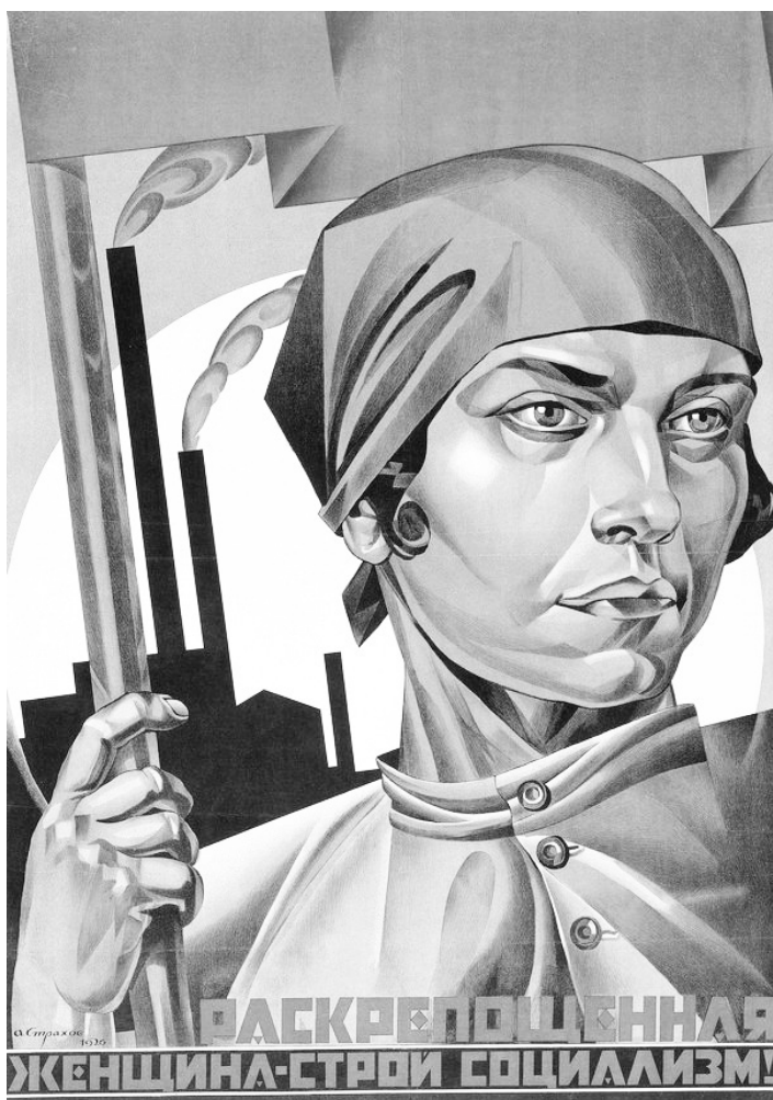
Σοβιετική αφίσα του 1926 με τίτλο «Οι χειραφετημένες γυναίκες χτίζουν το σοσιαλισμό»

κή εξουσία) ενάντια σ' αυτό το μικρό σπιτικό νοικοκυριό, ή πιο σωστά η μαζική ανασυγκρότησή του σε μεγάλο σοσιαλιστικό νοικοκυριό» 7 .