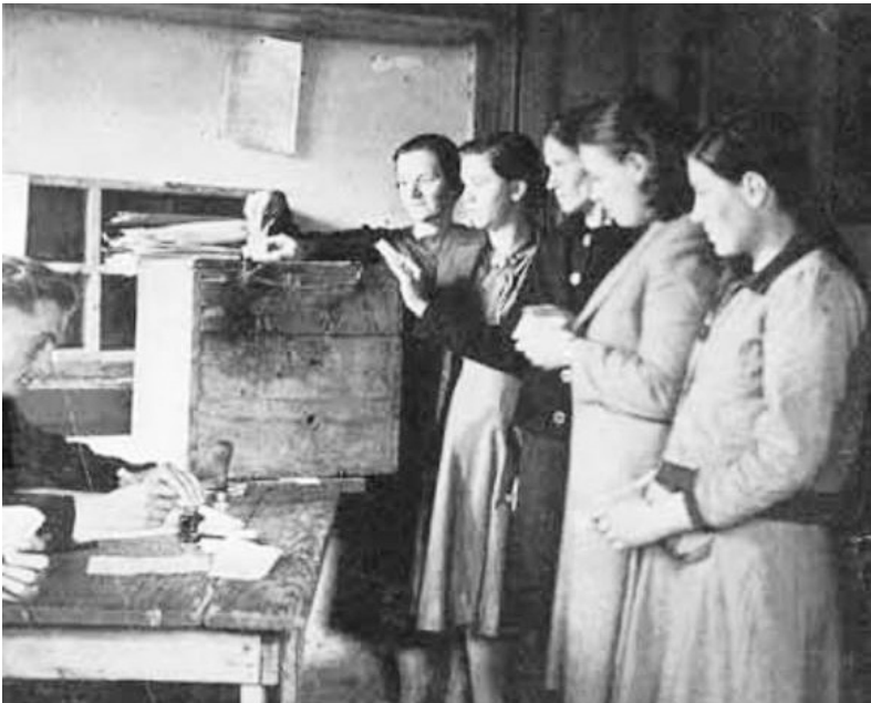
Γυναίκες ψηφίζουν για πρώτη φορά στην Ελεύθερη Ελλάδα

Εδραιώνοντας το ρόλο τους μέσα στην Αντίσταση, οι γυναίκες έβαζαν τα θεμέλια για τη χειραφέτησή τους, αποτινάσσοντας αιώνες προκαταλήψεων για το γυναικείο φύλο, τον προορισμό της γυναίκας, τη σχέση με τους άνδρες, το γάμο, την οικογένεια, τον έρωτα. Ακόμα στην Ελεύθερη Ελλάδα, ένα μεγάλο ποσοστό νέων γυναικών θα μάθει γράμματα και θα έρθει για πρώτη φορά σε επαφή με τη λογοτεχνία, την ποίηση, το θέατρο, την ώρα που τα ποσοστά αναλφαβητισμού για τον γυναικείο πληθυσμό της υπαίθρου ήταν τεράστια.