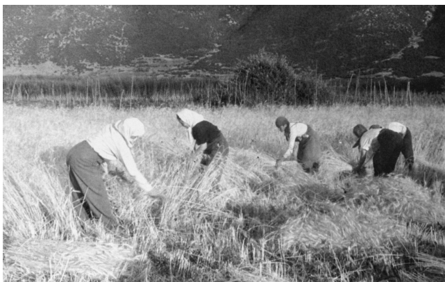
Αγρότισσες στην Ελεύθερη Ελλάδα

κάνει μάχιμη υπηρεσία μόνο αν το ζητήσει η ίδια». Η πλειοψηφία των γυναικών που εντάχθηκαν στον ΔΣΕ από την άνοιξη του 1948 και έπειτα ήταν κατά βάση στρατολογημένες από τις εμπόλεμες περιοχές και τα πεδία των μαχών της υπαίθρου και της Ελεύθερης Ελλάδας. Όσο φούντωνε ο Εμφύλιος, τόσο τα περιθώρια μη εμπλοκής τους στένευαν. Το μέλλον των γυναικών αυτών, αν παρέμεναν στα χωριά τους, ήταν κάτι παραπάνω από αβέβαιο, αφού στους πολεμικούς χάρτες οι περιοχές αυτές ήταν καταχωρισμένες στο λαϊκοδημοκρατικό στρατόπεδο. Κατά συνέπεια, άλλες περισσότερο και άλλες λιγότερο πρόθυμα εντάσσονταν στον Δημοκρατικό Στρατό. Επρόκειτο για κοπέλες νέες –όπως, άλλωστε, νέοι και νέες ήταν η συντριπτική πλειοψηφία των μαχητών και των μαχητριών του ΔΣΕ– οι οποίες προέρχονταν από περιοχές θετικά διακείμενες απέναντι στο ΕΑΜ, που είχαν βιώσει από πρώτο χέρι τη βία της λευκής τρομοκρατίας των φασιστικών συμμοριών.